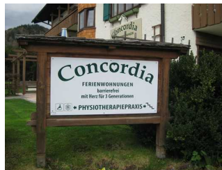
Willkommensschilder Ferienwohnung Concordia.