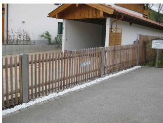
Beschilderung des Parkplatzes.