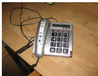
Telefon mit optischem Signal.