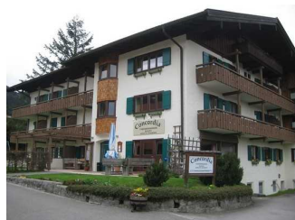
Außenansicht der Ferienwohnungen Concordia.