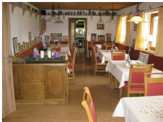
Tische und Stühle im Andreasstüberl.