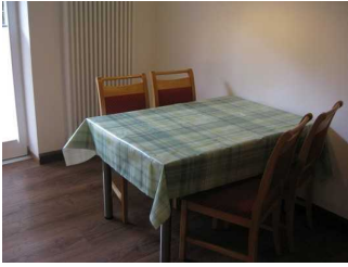
Esstisbereich in der Küche.