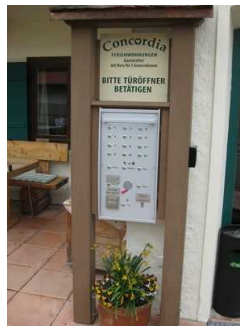
Türöffner und Klingeln.

104.101 Name und Logo des Betriebes/der Einrichtung sind von außen klar erkennbar.