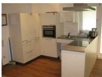
Ausstattung in der Küche.