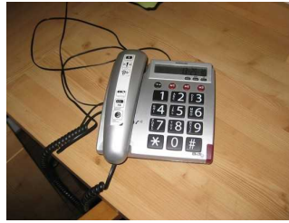
Telefon mit optischem Signal.