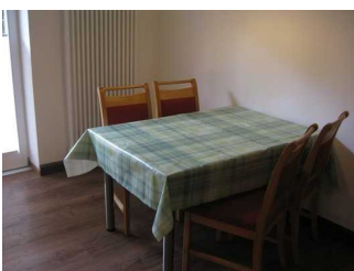
Esstisbereich in der Küche.