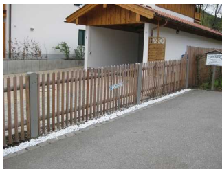
Beschilderung des Parkplatzes.