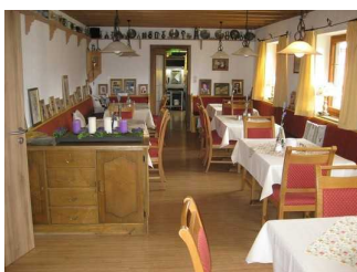
Tische und Stühle im Andreasstüberl.