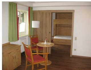
Ausstattung im Appartement 2. Zu sehen ist im Hintergrund das Hochbett.