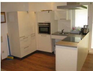
Ausstattung in der Küche.