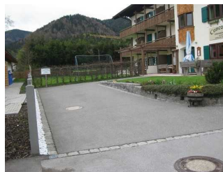
Fläche des Behinderten-PKW-Stellplatzes vor dem Eingang.