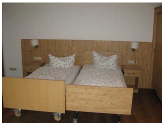
Betten im Appartement 2.