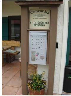
Türöffner und Klingeln.