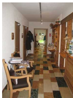
Flurbereich zu den Zimmer.